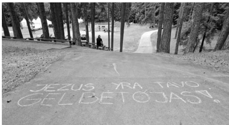
Po Kristaus šlovinimo šventės Dainuvos slėnyje likę piešiniai supykė festivalio „Devilstone“ organizatorius.