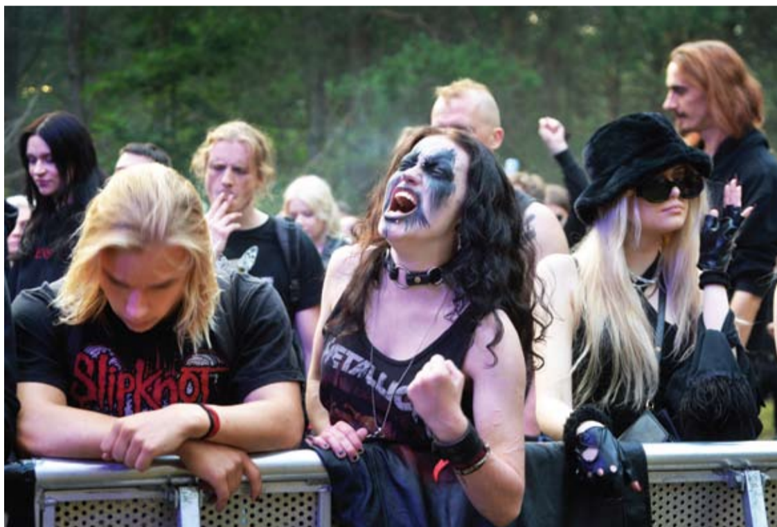
Festivalis „Devilstone“ Anykščiuose šiemet vyks 13-ą kartą.

Robertas ALEKSIEJŪNAS robertas.a@anyksta.lt