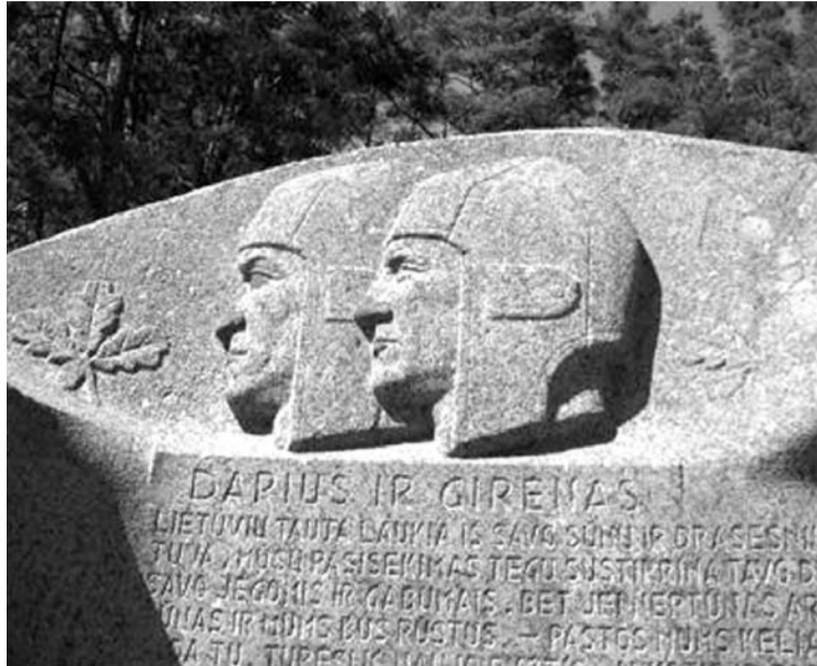
Savivaldybės iniciatyva šią vasarą lakūnų bareljefas ant Puntuko akmens buvo atnaujintas.

S. Dariaus ir S. Girėno skrydžio 90 metų „Atminties valandos“ minėjime prie Puntuko akmens, kaip ir kasmet, skambės muzika – pasirodys „Diamanti trio“, Anykščių kultūros centro meno mėgėjų kolektyvai. Plk. Prano Saladžiaus šau-